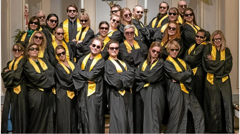
Die „Jakob Singers“ gastieren am Samstag in der Weimarer Jakobskirche